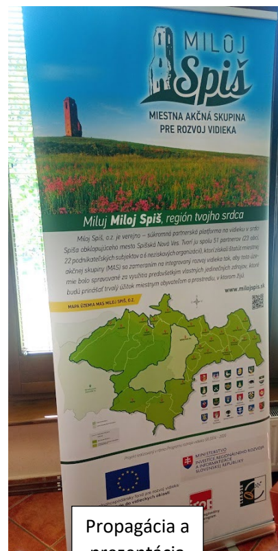
Propagácia a prezentácia MAS