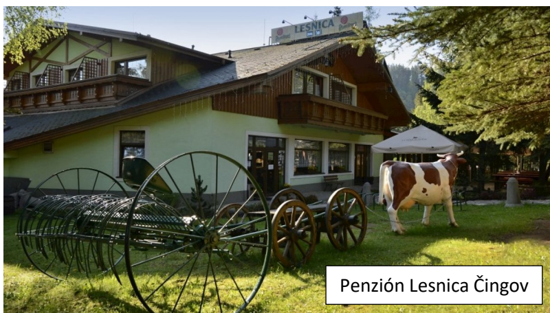
Penzión Lesnica Čingov