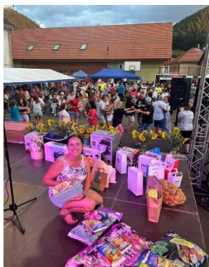
Otvorenie - Matejovské slávnosti 2024