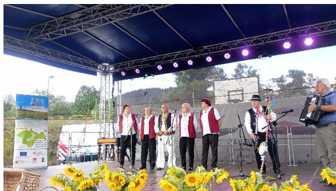
Putovná varecha Matejovské slávnosti 2024