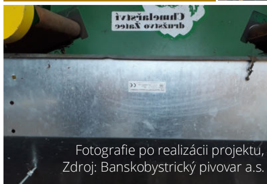
Fotografie po realizácii projektu, Zdroj: Banskobystrický pivovar a.s.