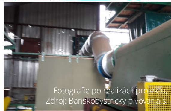
Fotografie po realizácii projektu