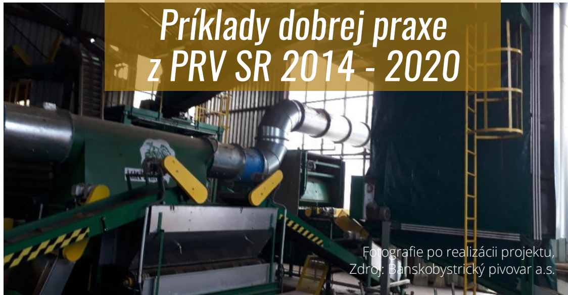
Fotografie po realizácii projektu, Zdroj: Banskobystrický pivovar a.s.