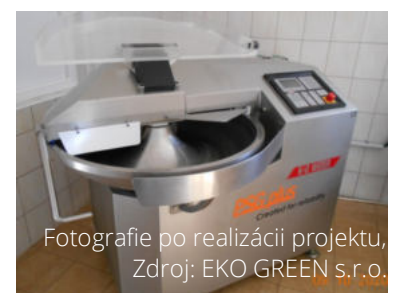
Fotografie po realizácii projektu, Zdroj: EKO GREEN s.r.o.