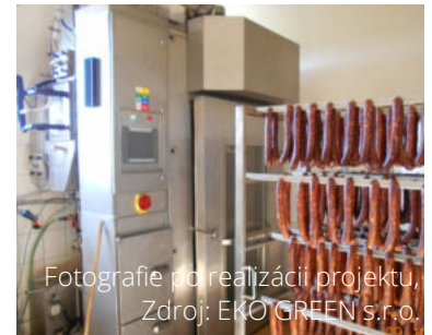
Fotografie po realizácii projektu, Zdroj: EKO GREEN s.r.o.